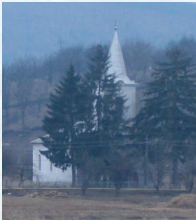
Structura confesiunilor religioase